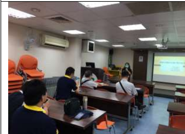
擺脫菸魔的糾纏~預防復抽