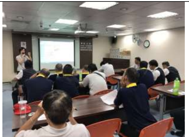
揭開菸的真面目/戒菸方法大公開