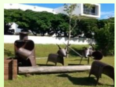
目的地-市立美術館