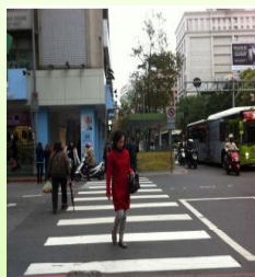
穿越中山北路 至錦西街北側