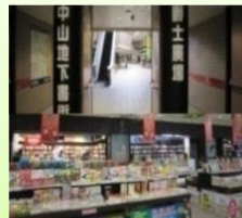
捷運地下爵士廣場書街