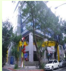
前美國大使官邸： 中山北路二段18號