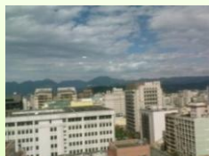
圖書館 知識充電好所在 遠望陽明山之美 身心靈之舒緩