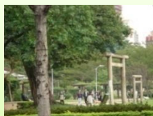
史跡價值處處可見