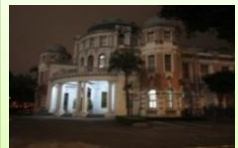
古蹟之美 監察院 保存最完整巴洛克建築