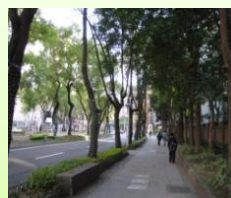
中山北路-大同大學