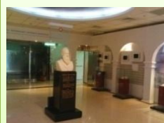
院史館 時光迴廊 學習馬偕精神