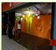
R9創意秀場 美麗的夢幻剪紙展出