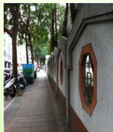
成淵高中旁紅磚道