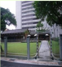
中山區運動中心： 中山北路二段44巷2號

台北市政府位舊廈：於長安西路49號為市定古蹟，建於大正十年（1921年），大正年代的建築風格日據時代建成小學的校舍，當年學童多為日本人子弟。台灣光復後，這裡長期做為台北市政府的辦公廳。市府搬走後，舊廈移作為當代美術館。因需過捷運且里程已超過2公里所以未列入此行，若同仁有興趣也可以去走走。