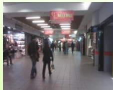
途中有很多家店可以逛逛且走起來有不一樣的心情囉！