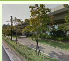
圓山捷運站 線狀公園