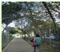
民權西往圓山幽徑小路