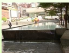
雖不是鴛鴦戲水， 卻是潺潺流水

這條宜古、宜今的步道可隨著個人的時間與需求決定速度與距離，因而我極力推薦同仁來經歷這讓人有回憶、有感藝術的現代步道。