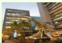
藝術之美 富邦銀行雕塑品 「鳳凰來儀」