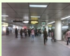
起點雙連捷運站，開始健走囉！