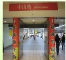
中山書街至捷運中山站