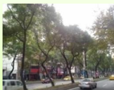
中山北路林蔭大道