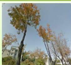
民權西路捷運站 線狀公園