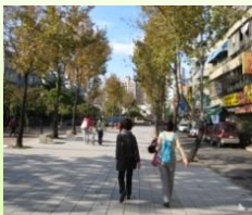
捷運步道-往民權西路