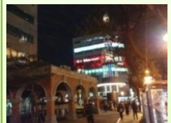
平安鐘 馬偕醫療團隊 效法耶穌基督精神 不分晝夜的工作 為台灣民眾的健康做守護