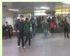
最後終點為台北火車站搭乘捷運的地方，既方便又省錢