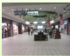
途中有專賣書籍可以提供休憩之處及培養氣質的休息站