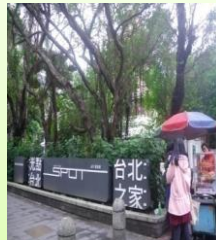
台北市政府衛生局 舊址：長安西路15號