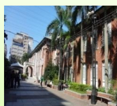
目的地到了!曾是台北市政府 的前身~當代藝術館