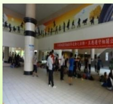
年輕學生熱力揮灑青春