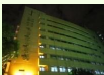
傳承之美 馬偕紀念醫院 寧願燒盡不願朽壞