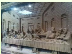
大禮堂 領受神的祝福 願主賜給大家智慧 指引正確的方向