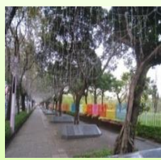
元宵燈海、美術公園