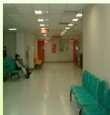
福音樓4樓X光室走道