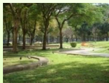
擁抱暖陽的青草地