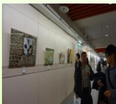
中山藝文廊展出超可愛的 貓照片讓人流連忘返