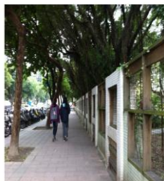
雙連國小旁 綠樹紅磚道