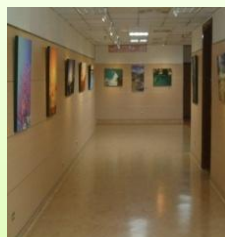
福音樓9樓大禮堂走道