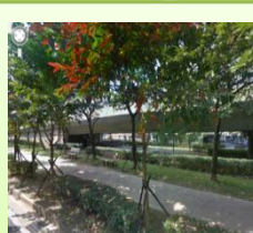
圓山捷運站 線狀公園